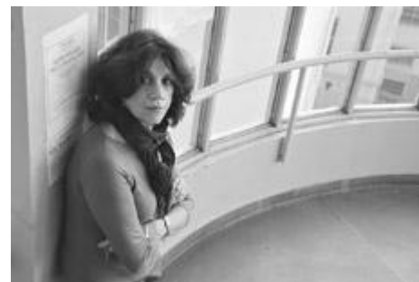
Imagen: Guadalupe Lombardo

–¿Y qué va a pasar con todo eso? ¿Se puede resistir a la globalización, ese monstruo grande que pisa fuerte? A mí me contaba un maestro de