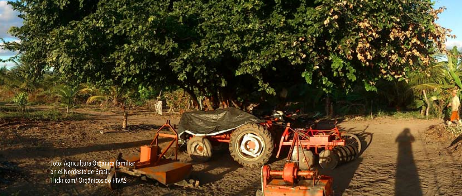
Foto: Agricultura Orgánica familiar en el Nordeste de Brasil.

Buena parte de la agricultura familiar se enfrenta al capitalismo más concentrado por el uso y la disponibilidad de recursos esenciales. Disponer y acceder a estos recursos es poder, dinero y capital. Y este poder se disputa y se pone en acción en los territorios, en los espacios productivos. Así fue y ha sido siempre a lo largo de toda la historia nacional y mundial.